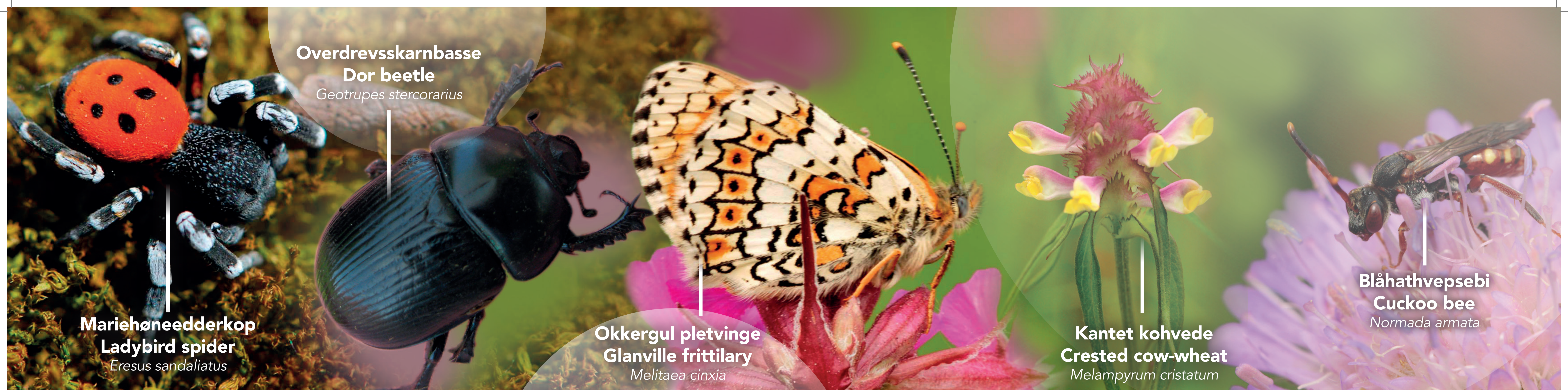
Mariehønedderkop Ladybird spider Eresus sandaliatus