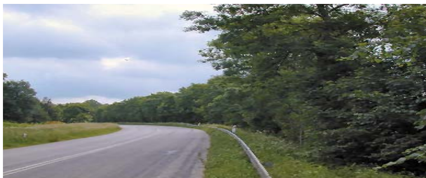
Figur 3: Levende hegn langs asfalteret vej med hurtig biltrafik.

og gående. Ved halvdelen af de uforstyrrede hegn er der foretaget eksperimentelle forstyrrelser i perioden april-juni i 2006 og 2007 (Figur 1). Her har 1-2 personer færdedes langs hegnene ca. 2 gange dagligt, svarende til hvad man må forvente vil blive et "normalt" forstyrrelsesniveau, hvis der åbnes for generel adgang langs de levende hegn. Hegn med årelang forstyrrelse fra biltrafik, cyklister og gående er udvalgt for at undersøge, om fuglefaunaen her er anderledes end i uforstyrrede hegn (Figur 2 og 3).