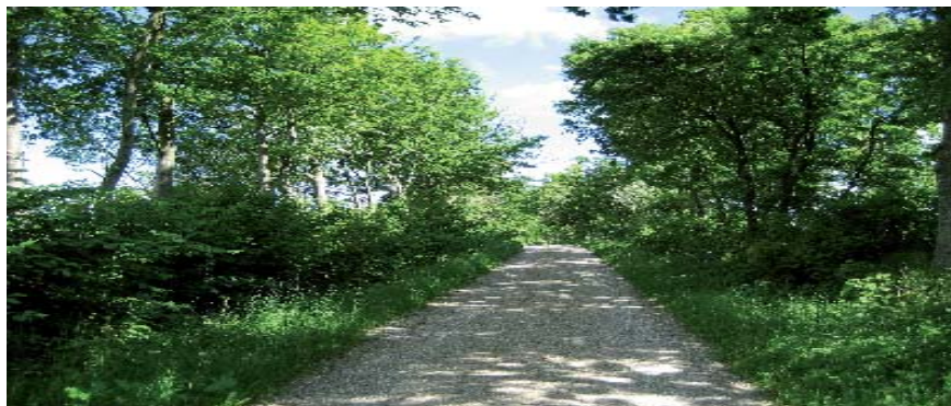
Figur 2: Levende hegn langs grusvej med relativ langsom biltrafik, cyklister og gående.