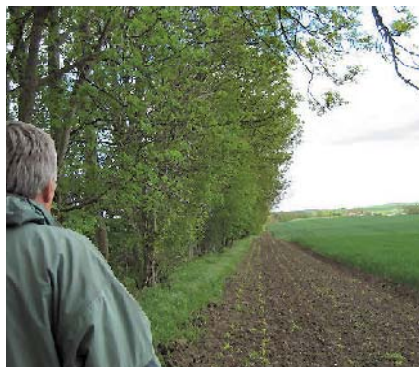
Figur 1: Levende hegn hvor den ene halvdel er eksperimentelt forstyrret, den anden halvdel uforstyrret.

For at undersøge hvor stor effekten af færdsel er på antallet af ynglende arter (territorier) og på antallet af individer af de enkelte arter, er fuglefaunaen blevet monitoreret langs ca. 10 km hegn i Mols Bjerge og ved Kalø Gods. De fleste hegn har været uforstyrrede en længere årrække, men der er også valgt hegn langs stier og veje med daglig trafik fra biler, cyklister